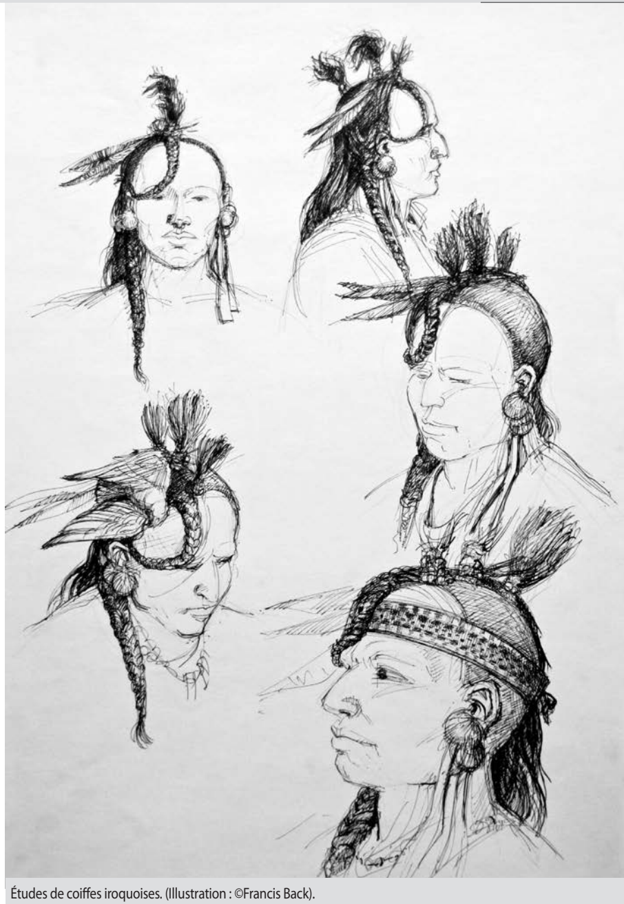
Études de coiffes iroquoises. (Illustration : ©Francis Back).

Alors a commencé un travail que je poursuis sans cesse depuis, soit passer au peigne fin les greffes de notaires, les archives judiciaires, les livres de compte de marchands, etc. Quand j'ai commencé mes recherches aux archives, il n'y avait qu'une seule photocopieuse et le prix des copies était trop élevé pour ma bourse d'artiste débutant; j'ai donc conservé l'habitude de recopier à la main l'information utile pour mes des-