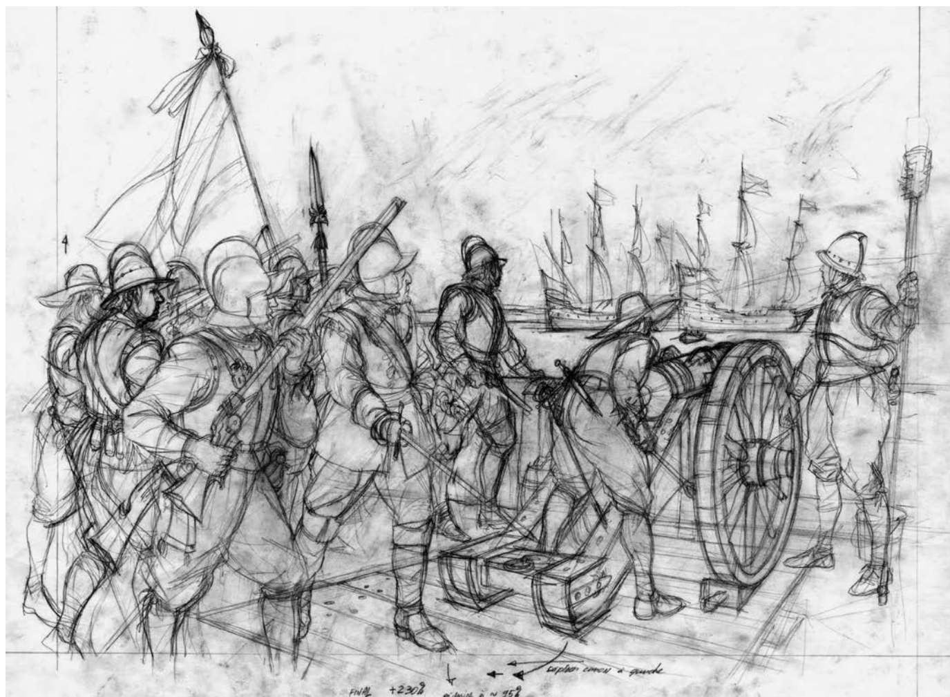
Attaque des frères Kirke à Québec, en 1629. (Illustration : ©Francis Back).

désir de créer de belles images, mais pour autant qu'elles soient le plus exactes possible. Au contact de ces gens, je me suis totalement reconnu dans cet objectif de mettre l'art au service du savoir historique.