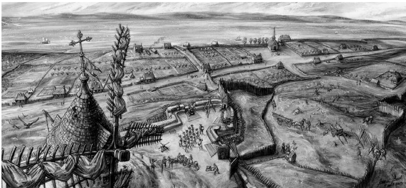
Quartier Bon-Secours en 1708. (Illustration : ©Francis Back). (Musée Marguerite-Bourgeoys/Chapelle Note-Dame-de-Bonsecours).

F.B. : Je n'avais pas vraiment le choix. L'enseignement des arts visuels au Québec, à cette époque, ne jurait que par l'art abstrait. Je voulais apprendre la perspective, l'anatomie humaine, les ombres portées. Bref, j'étais absolument à contre-courant par rapport à ce qui s'enseignait dans ces écoles.