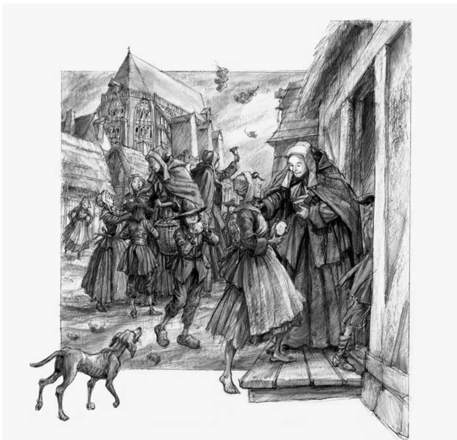
Marguerite Bourgeoys accueillant les enfants à l'école de Troyes. (Illustration : ©Francis Back).

Au début des années 1980, j'illustrais des productions scolaires à caractère historique pour l'Office national du film. Michel Brault préparait alors un film sur les patriotes; en voyant mon travail et mon intérêt pour l'histoire, il m'a demandé