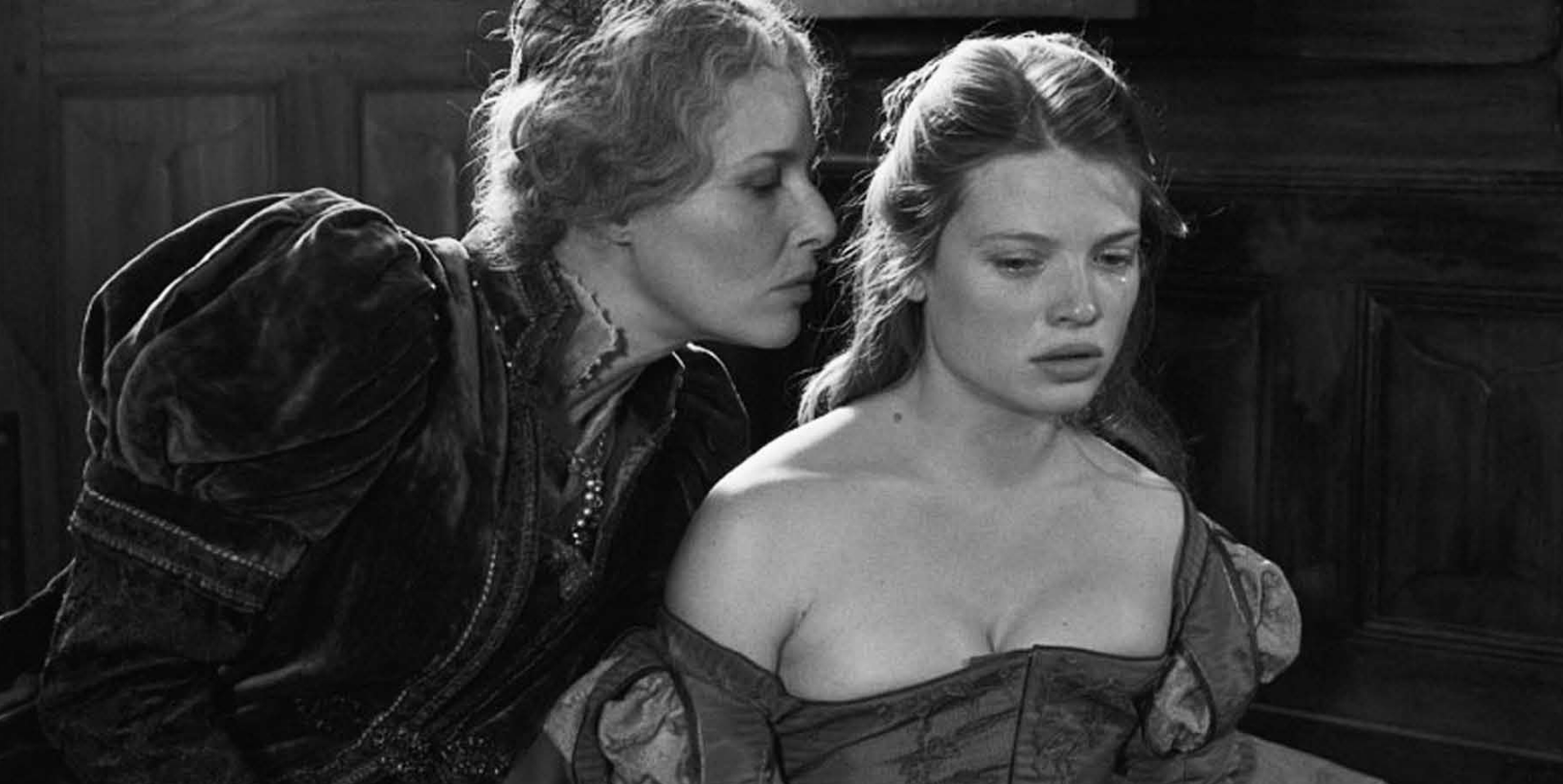
La Princesse de Montpensier de Bertrand Tavernier

Amoureuse et aimée, elle est à la fois victime et bourreau, feignant d'ignorer l'inclination destructrice de son guide, le comte de Chabannes, pour mieux tomber dans le panneau de l'amour inassouvi et sacrifié. Son égoïsme, posé en contraste à l'humanisme piétiné de Chabannes, n'a d'égal que les désirs qu'elle inspire, tel l'astre autour duquel se pâment mille prétendants : le duc d'Anjou, le prince de Montpensier, le comte de Chabannes et le duc de Guise. Elle est la flamme brûlante, fait naître le feu qui (se) brûle les ailes.