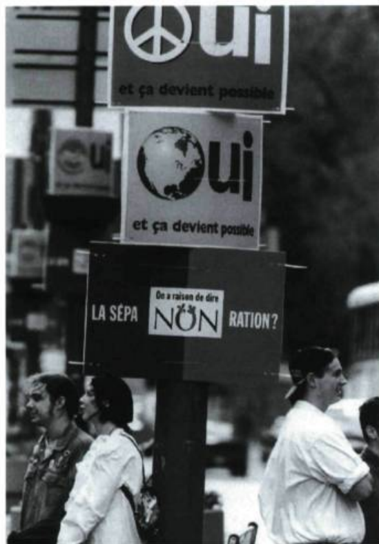
Référendum prise 2

Réal.: Jacques Godbout Scén.: Jacques Godbout, René-Daniel Dubois et Philippe Falardeau Image: Jean-Pierre Lachapelle Mus.: François Dompierre Mont.: Monique Fortier Prod.: Éric Michel - ONF Dist.: Office national du film