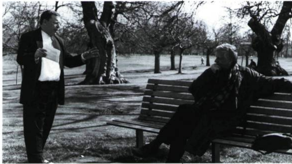
Le Sort de l'Amérique

Dans le Sort de l'Amérique , Jacques Godbout se penche sur un événement déterminant de l'histoire politique du Canada: la Bataille des Plaines d'Abraham (1759). Comme on le sait, cet affrontement a eu pour conséquence la victoire des troupes anglaises dirigées par Wolfe aux dépens des troupes françaises dirigées par Montcalm. Toutefois, les deux généraux ennemis ont trouvé la mort au cours de la confrontation. À partir de là, plusieurs mythes se sont créés, tant au Québec qu'au Canada anglais. Le sujet est, il va s'en dire, passionnant mais Godbout trouve le moyen de le bousiller. Un peu comme cela avait été le cas dans le Mouton noir (1992), le réalisateur multiplie les digressions et perd de