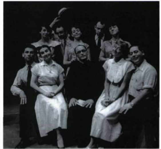
L'Aventure des Compagnons de saint Laurent