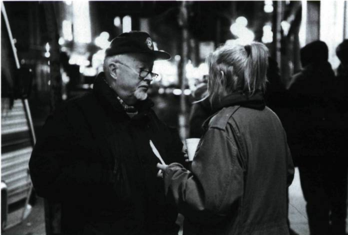
Tu as crié: «Let Me Go» d'Anne Claire Poirier

Narr.: Louise Marleau et Claude Gauthier