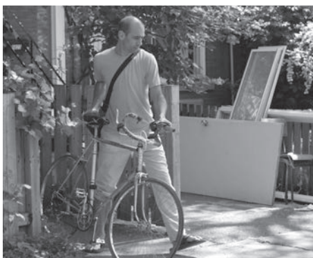
Le Gardien d'hiver

Ce film aborde le thème des liens familiaux, l'un des plus emblématiques des