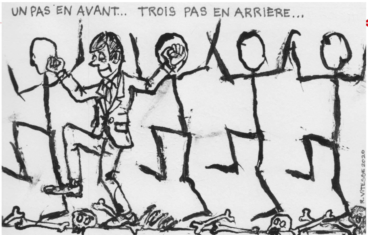
Illustration: Ramon Vitesse.