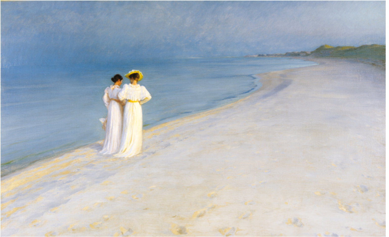
Sommeraften på Skagen Sønderstrand (Summer Evening on the Southern Beach) . Peinture : Peder Severin Krøyer, 1893.

La conversation est un besoin, même quand on a perdu ses capacités cognitives. Une autre langue se pratique. Je parle à Madame L. d'un tableau accroché au mur de sa chambre. « J'aime beaucoup celui-là, en bas », dit-elle. Or, il n'y a pas de tableau, plus bas. Elle pointe du doigt une couverture rose fleurie, déposée en tas sur une chaise. Nous échangeons elle et moi sur les couleurs, les formes, les qualités de ce «tableau». C'était une conversation agréable, réaliste à ses yeux et... si poétique aux miens. J'aurais sans doute vu les choses différemment si elle avait été ma mère, mais voilà, je suis bénévole.