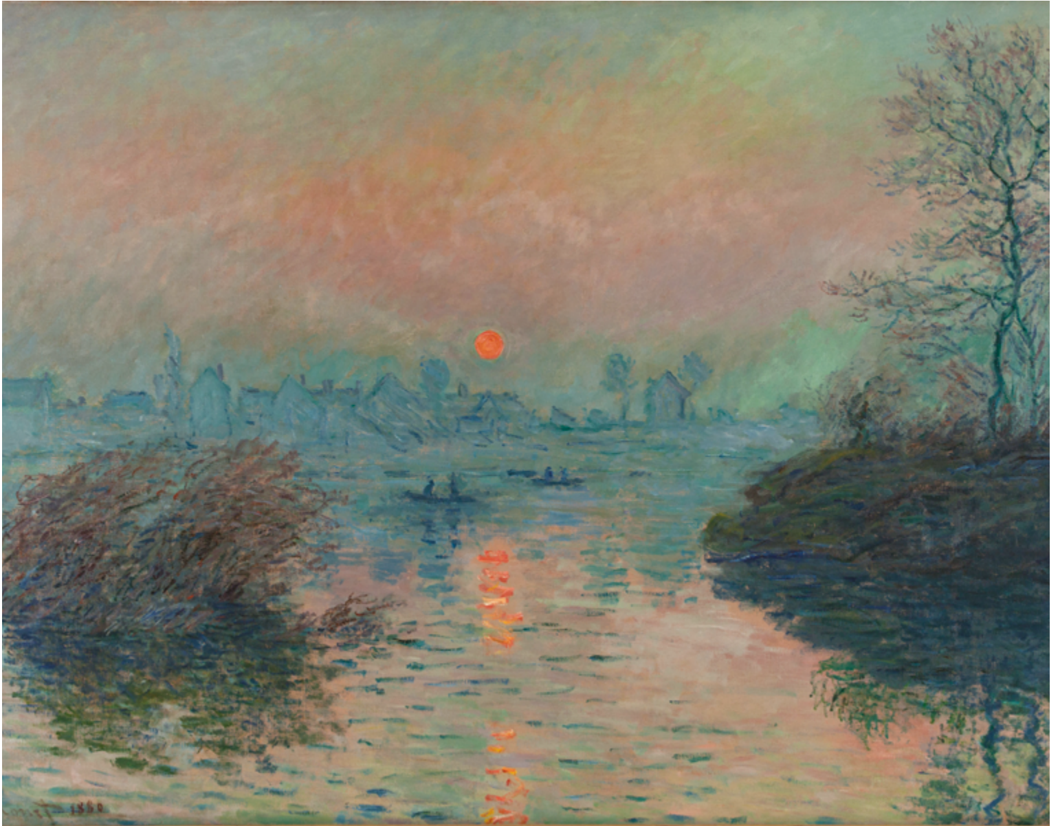
Soleil couchant sur la Seine à Lavacourt, effet d'hiver. Peinture: Claude Monet, 1880.