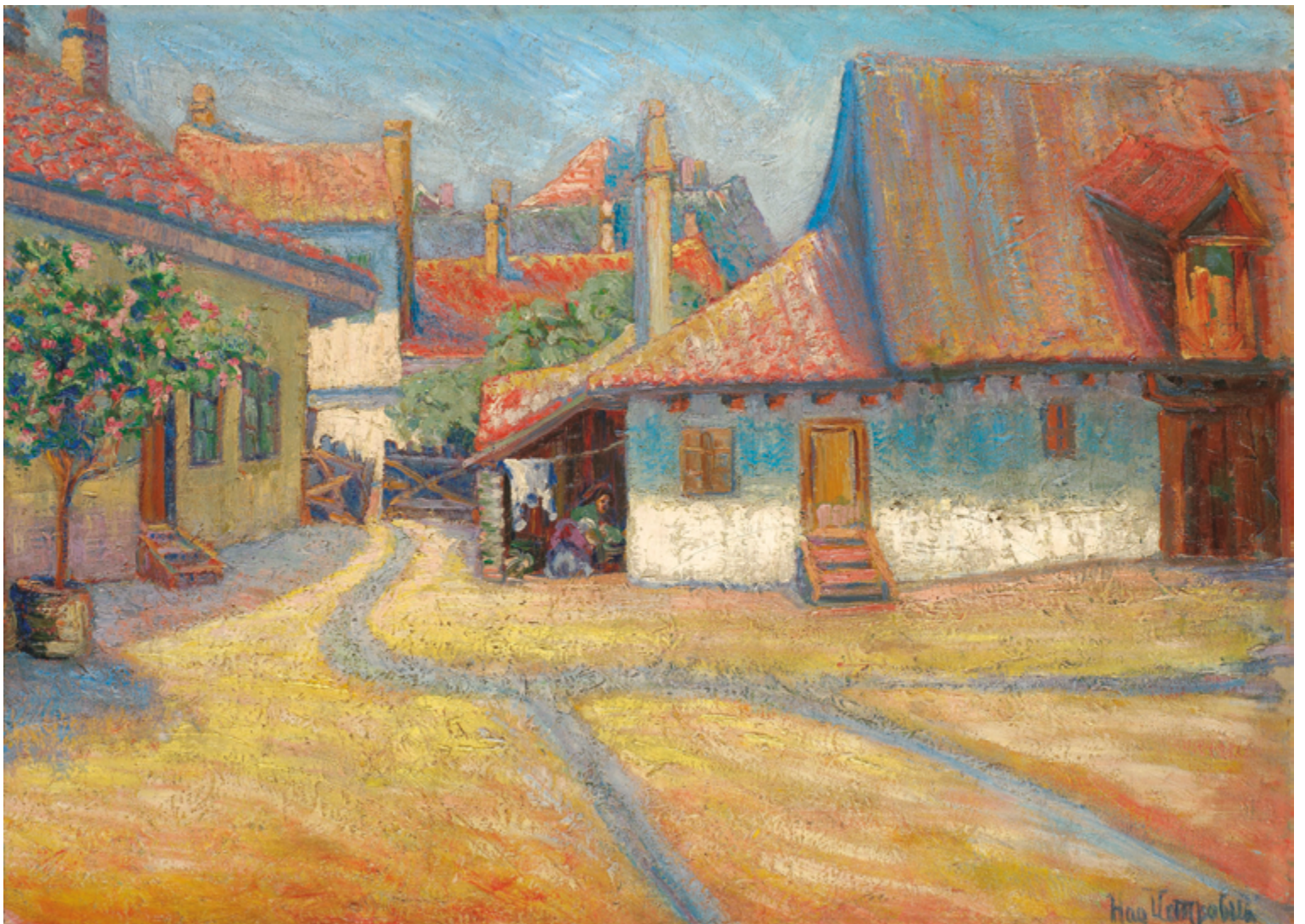
Belgrade Suburb. Peinture : Nadežda Petrović, 1908.

Comme je l'ai également documenté sur le terrain, plusieurs propriétaires n'hésitent pas à employer la maltraitance financière et psychologique pour parvenir à expulser des locataires vieillissant·e·s, en ayant ou non recours aux mécanismes légaux permettant la reprise et l'éviction. Ce climat d'intimidation et de violence, qui se déploie majoritairement dans la sphère privée et donc hors du regard public, décourage les locataires âgé·e·s à invoquer l'article 1959.1 dans de longues et éreintantes procédures à la Régie du logement. Notons qu'entre juin 2016 et février 2019, seulement 17 cas de reprise de possession à la Régie du logement furent contrecarrés grâce à l'article 1959.1 5 . Une fois expulsé·e·s, où ces locataires vieillissant·e·s pourront-ils se loger? À Montréal, selon les chiffres du recensement de 2016, le revenu annuel médian après impôt des personnes âgées de 65 ans et plus, tous genres