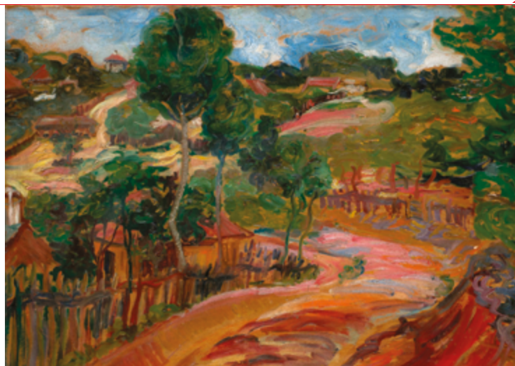
Resnik. Peinture : Nadežda Petrović, 1905.

En effet, comme les problèmes (et solutions) concernant l'intégration sociale des personnes vieillissantes ne peuvent plus être pensés hors de la certitude de l'effondrement, l'époque actuelle représente une opportunité immense pour repenser les relations