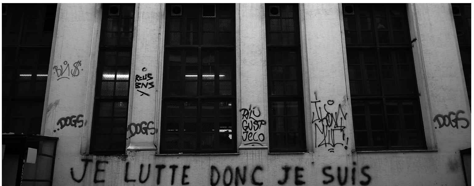
Titre du documentaire, sorti en 2015, Je lutte donc je suis de Yannis Youlountas, dans la rue Solomou, Exarcheia, Athènes.

Cela remet en cause l'un des principaux acquis issus de la révolte contre la dictature des colonels (1967-1974) qui avait notamment fait face à l'occupation de la Faculté de droit de l'Université polytechnique nationale par des étudiants en 1973 à Exarcheia. C'est dans ces lieux hautement symboliques qu'il y a 47 ans, des étudiants s'enferment et se barricadent pour mettre en place une radio clandestine qui génère un soulèvement généralisé. Des milliers de travailleuses et travailleurs, ouvrières et ouvriers, agricultrices et agriculteurs ainsi que des étudiant·e·s convergent vers le centre d'Athènes en dépit des charges violentes de la police. La manifestation du 16 novembre 1973 rassemble plus de